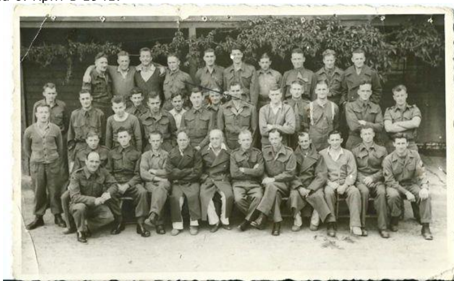
Австралийские пленные в лагере Stalag 13

В 1941 лагерь пополнился сербами, поляками и русскими, после успешного продвижения немцев на восточном фронте; сербы прибыли весной, а русские – летом. Некоторые британцы, австралийцы и другие союзники сдались в плен после операции Меркурий на о. Крит в 1941.