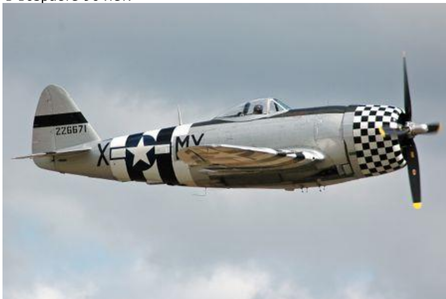
P47 Thunderbolt

Одним из американских военнопленных лагеря Oflag 13 в Хаммельбурге был Вальтер Фредерик Моррисон (Walter Frederick Morrison), the inventor of the frisbee . Он был летчиком-истребителем и был сбит ан американском штурмовике а P-47 Thunderbolt. Он умер в 2010 в возрасте 90 лет.