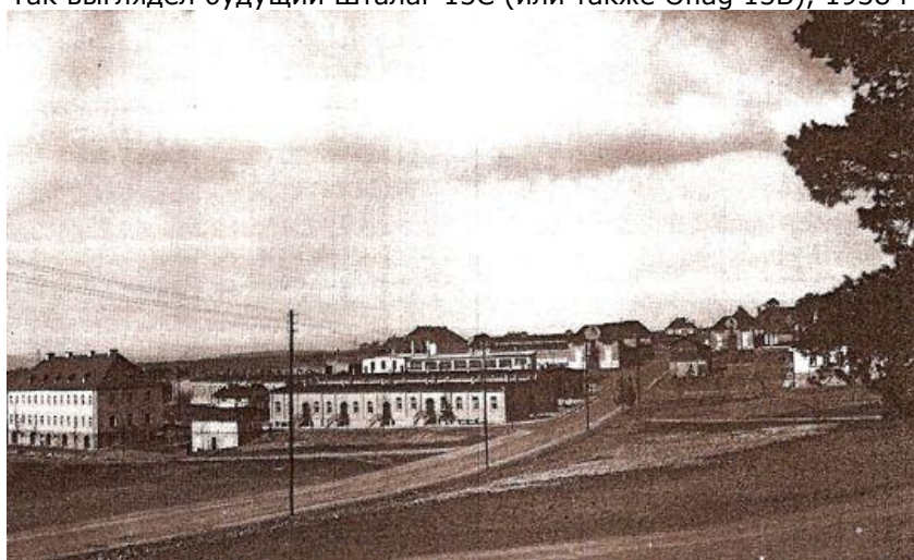
Лагерь Хаммельбург, 1938

В 1938 г. лагерь экспансировал и поглотил 2 близлежащие деревни. С того момента этот т.н. город-призрак Боннланд (Bonnland) стал использоваться в качестве живого макета для обучения боевым действиям в условиях города. (См. видео German Army video.)