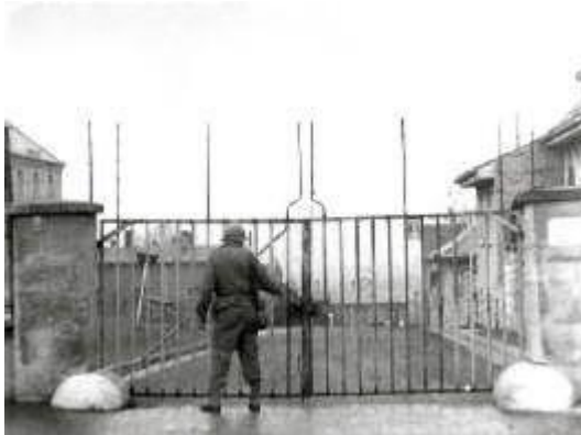
Вход в лагерь Stalag 13, 1945 г.

Летом 1940 года южную часть лагеря подготовили для приема военнопленных рядового и сержантского состава. Лагерь получил название Штаммлагер (Stammlager) XIII C , или кратко Шталаг (Stalag) XIII C, а деревянные бараки построили для военнопленных разных национальностей.