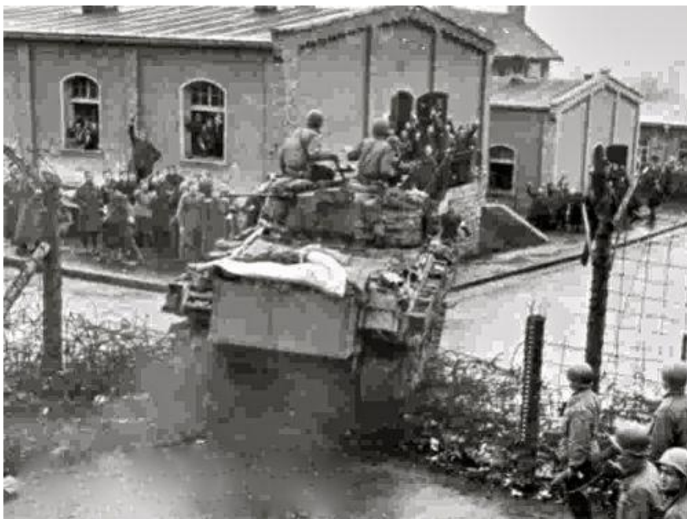
Танки армии США вошли в лагерь Oflag 13B, 1945

Здания на фото сверху сохранились до сих пор. Как сейчас выглядит лагерь Хаммельбург, Вы можете посмотреть на онлайн-карте. Проход внутрь зданий запрещен, но глянуть на лагерь можно через забор у центрального входа в лагерь.