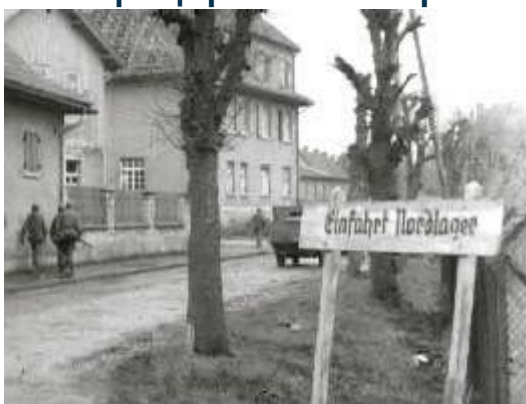
Северный вход в лагерь Oflag 13В

Офицеров селили в каменных постройках в северной части лагеря (the Nordlager = Северный лагерь Норд ), отдельно от рядового состава, исключение делалось только для небольшого количества младшего состава и служащих, которые прислуживали офицерам. Этот лагерь получил название офицерского лагеря XIII В или кратко Oflag 13 В.