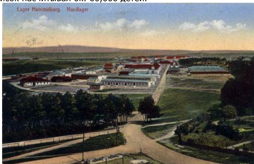
Лагерь Хаммельбург в 1916

Сиротский дом содержался при бенедиктинской богадельне. За время своего существования он прирос многими новыми корпусами. Когда его закрывали в 1930, послужной список насчитывал ок. 60,000 детей.