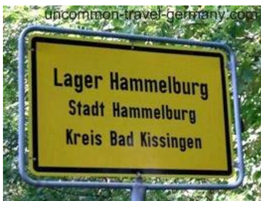
Дорожный знак с указателем направления на лагерь для немецкой армии

В 1893, кайзер распорядился о создании тренировочного полигона для немецких солдат, который был обустроен на большом участке лесистой местности, ок. 2.5 миль (4 км) южнее Хаммельбурга. Этот тренировочный комплекс называли лагерь Хаммельбург (нем.: Lager Hammelburg , англ.: Camp Hammelburg), это название сохранилось до сих пор.