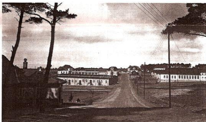
Так выглядел будущий Шталаг 13С (или также Oflag 13В), 1938 г.

Так лагерь выглядел в 1938 г., тогда здесь расквартировался артиллерийский полк: