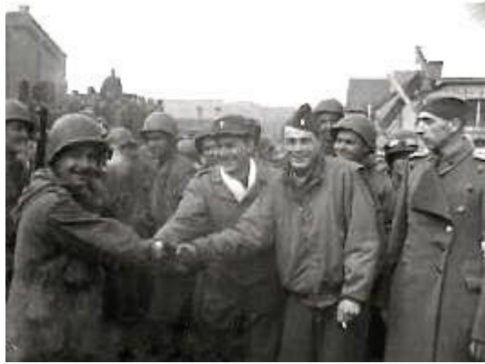
Освобожденные пленные лагеря Stalag 13C

Несколькими днями позже, танковая дивизия выдвинулась к линии фронта для воссоединения с боевыми частями, оставив отдельное подразделение в лагере. В течение следующего месяца никто не принял командование над военнопленными в лагере, и они, будучи предоставленными сами себе, что послужило причиной мародерства в близлежащих населенных пунктах, не исключением был и Хаммельбург. Когда Германия подписала 8 мая 1945 года пакт о капитуляции и наступил мир, американские войска вернулись, чтобы занять лагерь Хаммельбург и навести порядок в городе. Оставшиеся военнопленные были отпущены по домам.